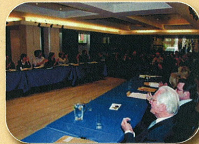
Présentation du projet Active Learning de l'école Joli-Bois