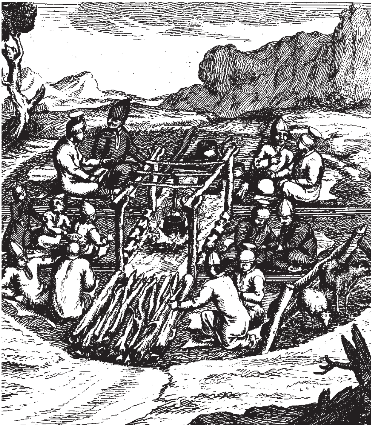
Interiør og sosial romdeling i samisk gamme. Det steinsatte ildstedet lå midt på gulvet, og mellom ildstedet og døråpningen var plassen for brenselet. Også bak ildstedet var det et avgrenset felt, hvor matvarer og redskap til matlagning ble oppbevart. Tidligere var dette rommet «hellig», bl.a. ble runeomma oppbevart her, og kvinnene skulle ikke bevege seg innenfor det avgrensede området. Foreldrenes plass var innerst på høyre side. De små barna lå på samme side, men litt lenger ut mot døra. På venstre side hadde de voksne sønner og døtre plass. Hvis det bodde to familier i gammen hadde de hver sin side. Fra Knud Leem, 1767.

Innredningen i telt og gammer var temmelig ensartet, med en steinrekke fra inngangen til