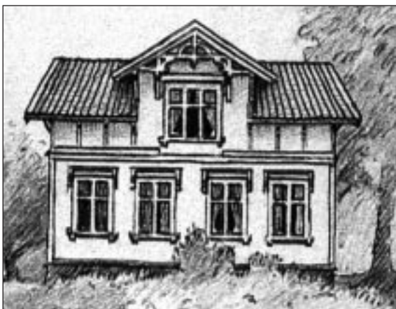
Sveiserhus fra siste del av 1800-tallet. Fra heftet Ta vare på kommunelandskapet, utgitt av Kommuneforlaget 1989. Ill.: Vidar Asheim

Bygningsfredningsloven trådte i kraft i 1921 og var den første loven for det offentlige bygningsvernet; gjennom fredning skulle bygningsarven sikres. I løpet av 1920-årene ble det fredet en stor mengde bygninger. Kriteriene det ble fredet etter var alder, sjeldenhet og det beste landet hadde frembragt av estetisk og håndverksmessig kvalitet. Det var gjerne velhavende mennesker som hadde slik hus, og i registeret over hus som ble fredet i denne perioden finner vi hovedsakelig praktbygninger: store våningshus, stabbur, storgårder samt kjøpmannsgårder og handelssteder. Husmannsplassen og det lille jærhuset var totalt fraværende. Ut fra tidens forutsetninger var utvalget utvilsomt framsynt. Endrete samfunnsforhold har imidlertid fått oss til å se med nye øyne på hva som er umistelig.