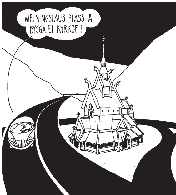
Illustrasjon: Ola H. Øverås

minner. Det ble aldri utarbeidet skriftlige saksbehandlingsregler, og dette har ført til at bygningene har fått en svært vilkårlig behandling. For å kunne gi de bevaringsverdige bygningene tilstrekkelig vern fant Riksantikvaren at de måtte fredes formelt.