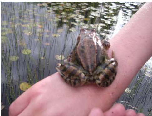
Bildet: En frosk minnet oss om at det også finnes større vanddyr i dammen.