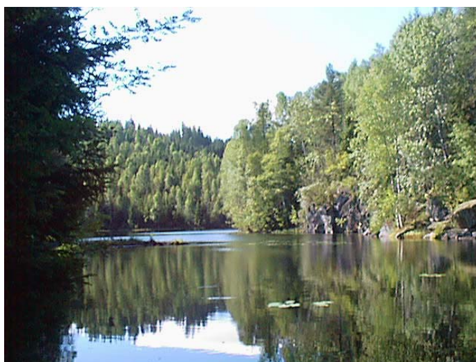
Parti fra Østbyputten

I løpet av vår tid på ungdomsskolen, har vi benyttet lokalmiljøet ved å besøke et skogsvann ved navn Østbyputten. Østbyputten ligger i gangavstand fra vår skole. Turene våre til Østbyputten har blitt gjennomført til forskjellige årstider og hatt ulike mål; vi har hatt i oppgave å gjøre oss kjent, oppleve naturen, bruke sansene for å oppdage hva som eksisterer i naturen, utføre økologiske observasjoner og nå i år oppgaver i forbindelse med vann.