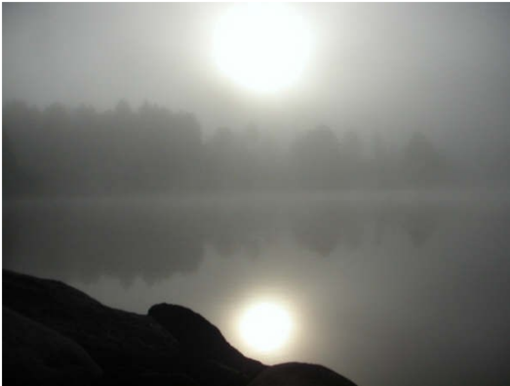
Toke i dis