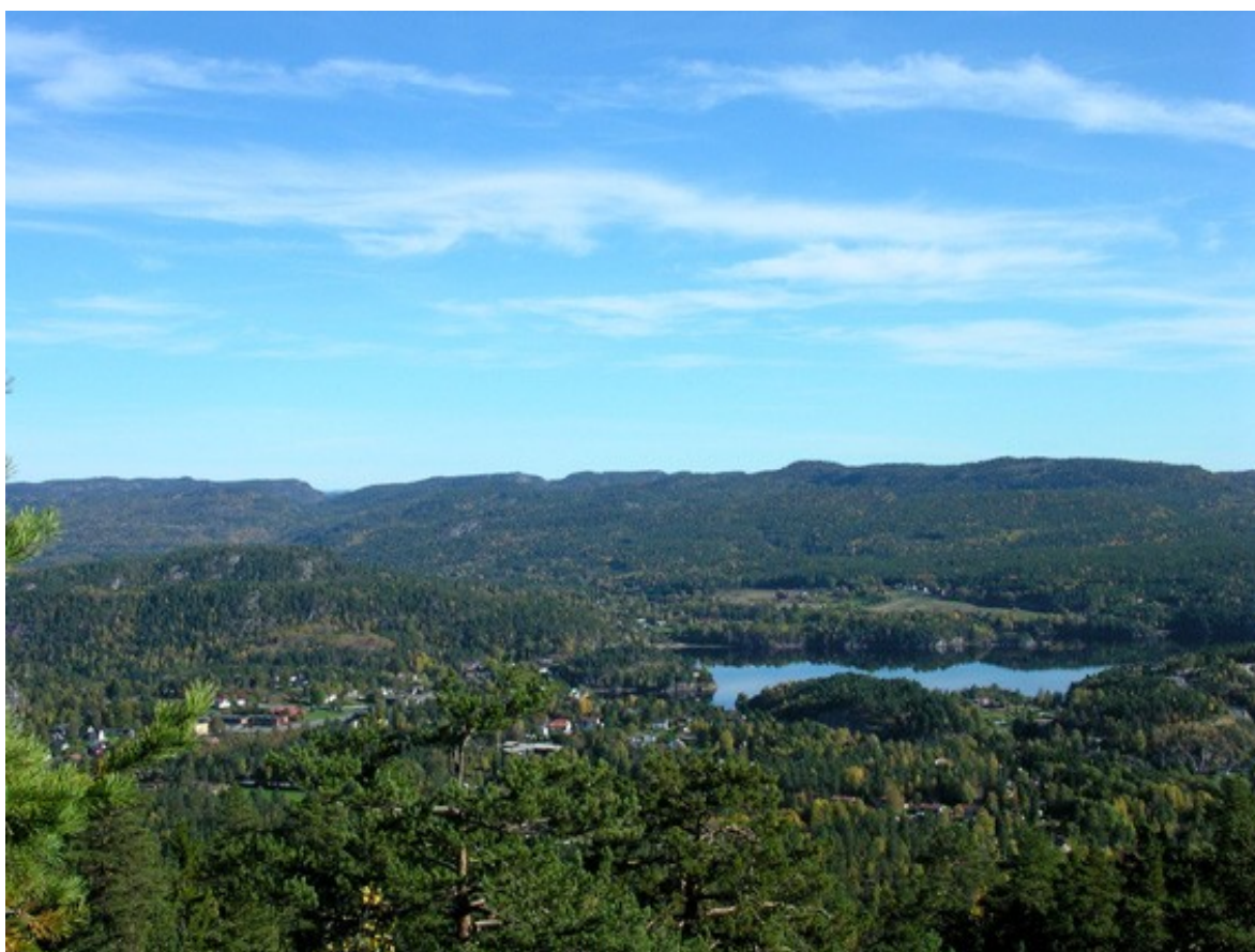
Utsikt over del av Toke

Hvert år bruker 10. klassene i Drangedal dette området i miljøundervisninga, men Utdanningsdirektoratets utlysning av konkurransen "Vann i lokalt og globalt perspektiv" i år ble en ekstra inspirasjon.