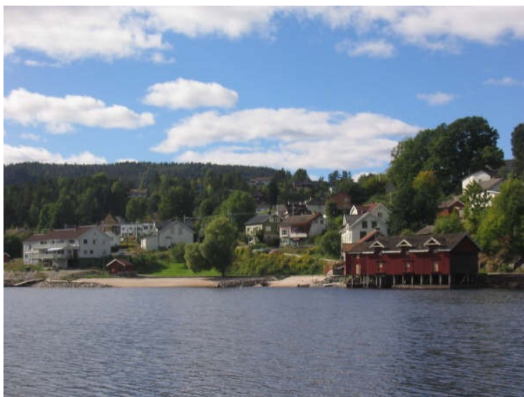
Toke og Prestestranda