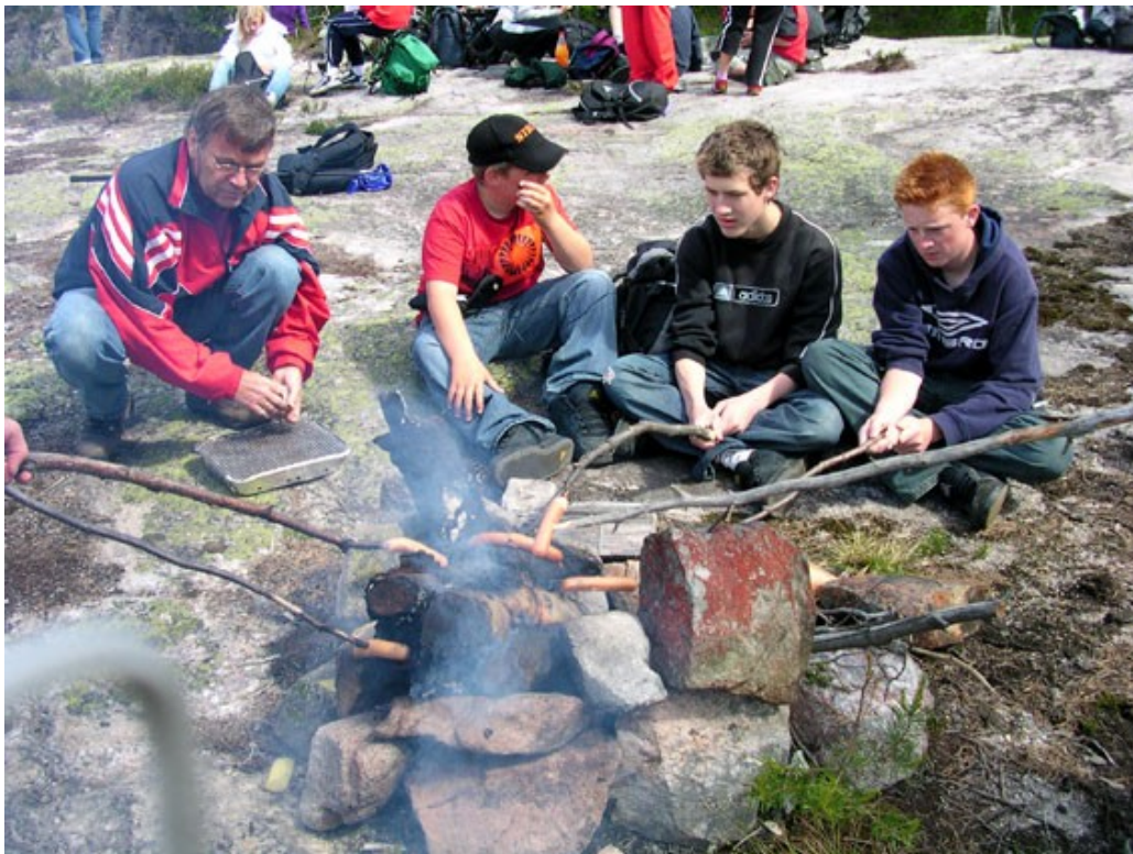
Matpause med pølsegrilling