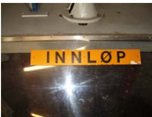
Innløpet: her kommer alt inn