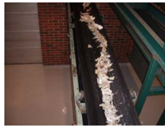
Samlebånd med doavfall