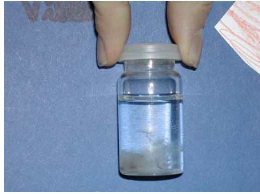
Kjøtt fra ørret