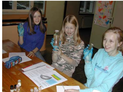
Her ser vi prosjektgruppa i arbeid.