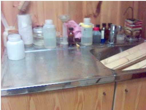
Her blir fisker og dyr rensket