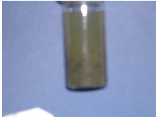
Mjøsa anno 1975