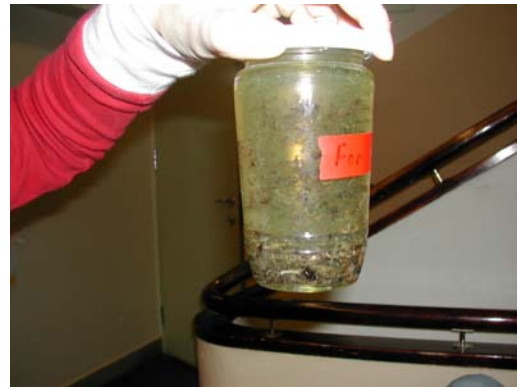
Dyr fra Svartelva